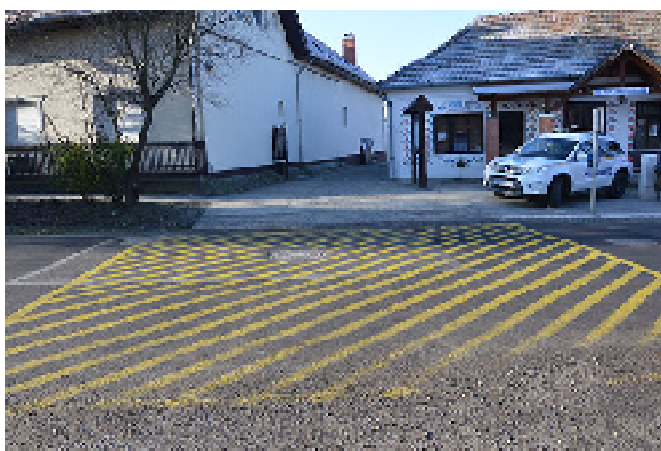
A forgalomtól elzárt jelzés felfestése a tüzoltóautó zavartalan kihajtását biztosítja.