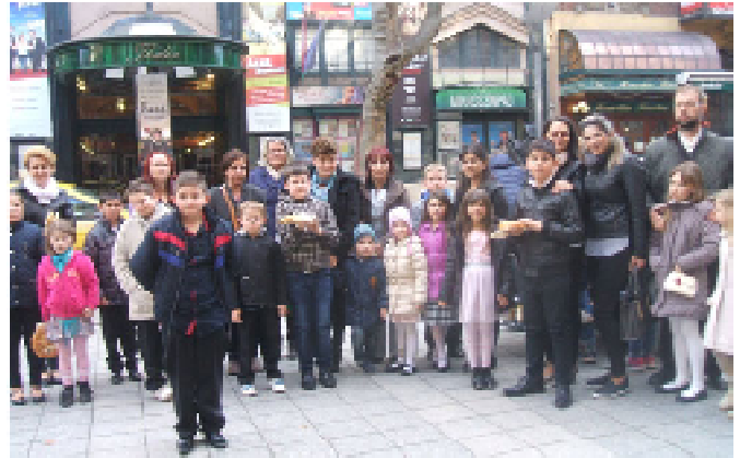
Színházlátogatás - alsósokkal.