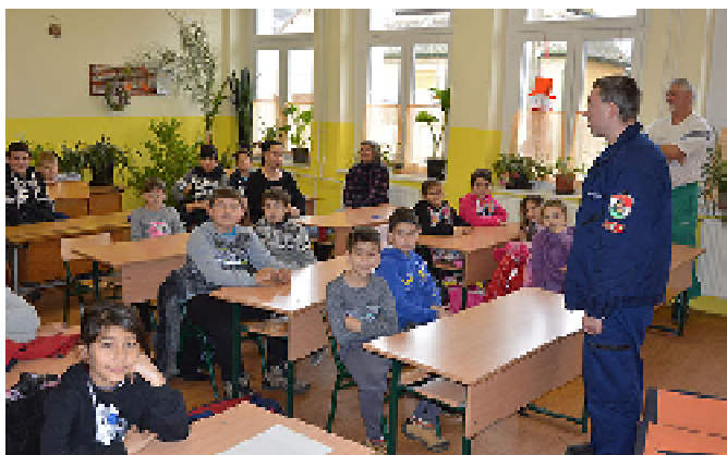
Katasztrófa-védelmi előadás az iskolában.