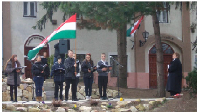
Megemlékezés március 15-én.