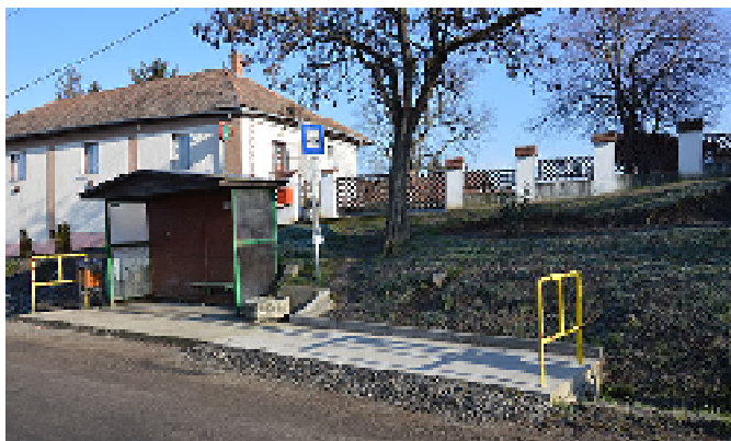
A buszvárók meghosszabbítását mindenhol megoldottuk.