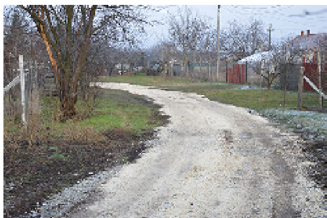
A felújított újmajori út.