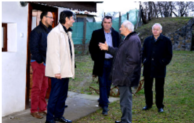
Ipolysági testvértelepülésünkről látogattak Héhalomban.

A testvértelepülésekkel azóta is szoros kapcsolatot ápolunk, aktív részvevői vagyunk egymás rendezvényeinknek, ahol közösen ápoljuk a kulturális örökségünket erősítve a magyarság összetartását.