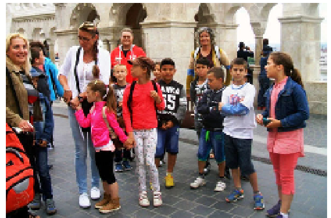
Kirándulás a budai várba.