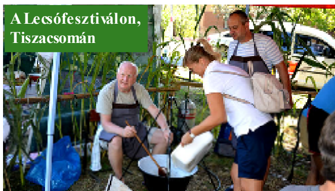
A Lecsófesztiválon, Tiszacsomán