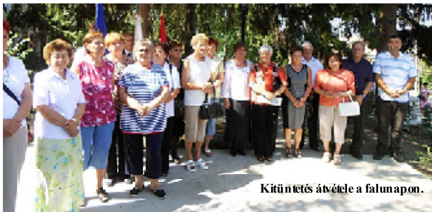
Kitüntetés átvétele a falunapon.