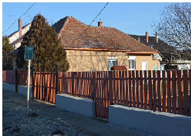
A Deme-házkülső fedújtása megtörtént.