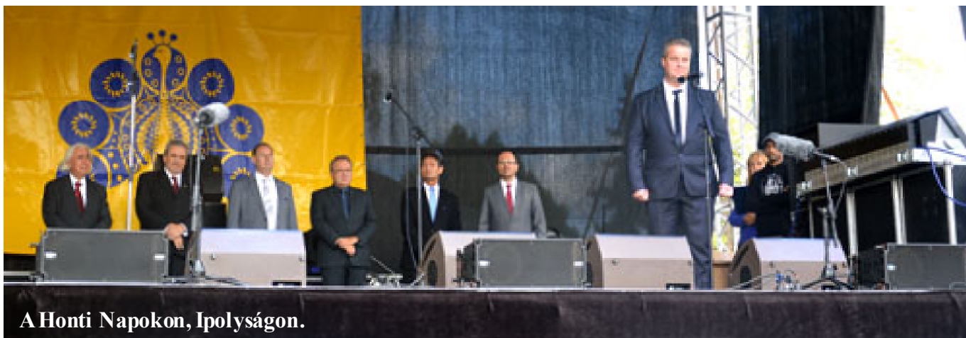
A Honti Napokon, Ipolyságon.