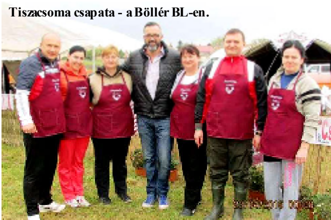
Tiszacsoma csapata - a Böllér BL-en.