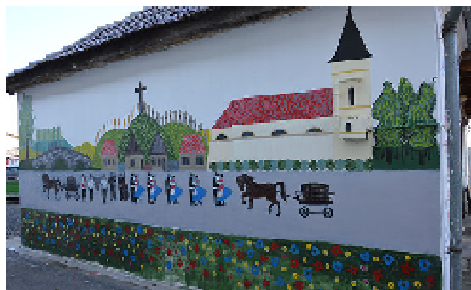
Héhalmi fiatalok alkotása.