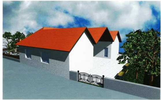
A piac látványterve

terményeiket értékesíthesse. Azt reméljük, hogy mindezek révén bevételhez juthat a termelő és jó minőségű, helyben termelt friss terményekhez juthatnak a vásárlók. A piac a kultúrház épületében és a környező kertjében valósul meg.