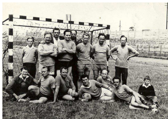
Két kép a hőskorból