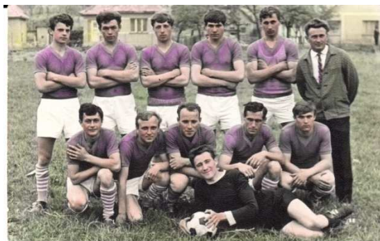
A focicsapat 1968-ból