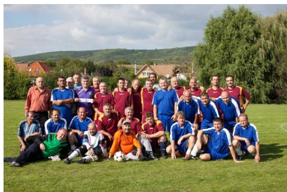
Az öregfiúk csapata egy Tesmag elleni mérkőzés után