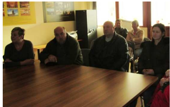
A penci látogatók csoportja

kondicionálva helyezték el. Elkészült az egyik medencesor fölé a könnyűszerkezetes acélcsarnok, ami az időjárás elleni védelmet szolgálja. Jelenleg az úgynevezett konténment épület és annak gépészeti rendszere készül, ami a nyitott medencéket lefedő, belső, zárt épület egység. A hulladék kitermelés során a konténmentből csak szűrt levegő juthat ki a környezetbe.