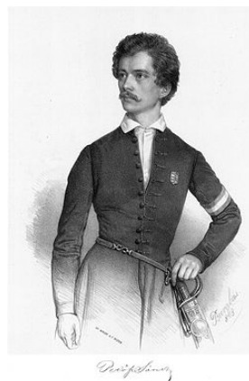
Petőfi Barabás Miklós festményén

P.S. Írj vissza, mihelyt alkalom adatik s' tudósíts a pozsonyi körülményekről.