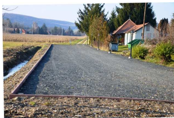
Parkoló a temető bejáratánál