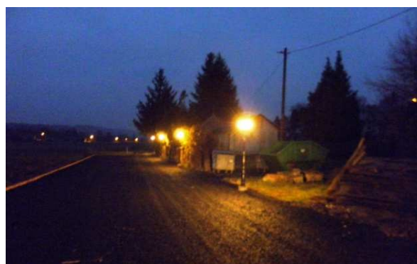
Az új közvilágítás