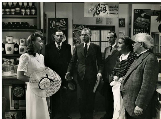
Jelenet a Rózsafabot című filmből

A primadonna 1915. április 20-án született. Jövőre lesz születésének századik évfordulója. Még csak elsőéves növendéke volt a Magyar Színművészeti Akadémiának, mikor első filmfőszerepére szerződtek. A kezdődő nagy siker nem kényeztette el, elvégezte a Színművészeti Akadémiát, s a budapesti magánszínházak csábító ajánlataival szemben az ország első prózai színháza, a Magyar Nemzeti Színház ösztöndíjas szerződését fogadta el. Itt első perctől kezdve főszerepeket játszott, s működésének második évében már a legtehetségesebb fiatal színésznőnek ítélte Farkas-Ratkó díjat is elnyerte. Egyaránt volt antik és modern klasszikusok hősnője. Huszonnégy magyar film főszereplője volt.