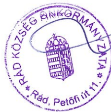
Lieszkovszki Gábor polgármester