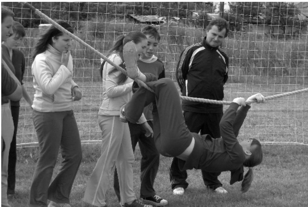
Gyermeknap: Mint a lajhár!