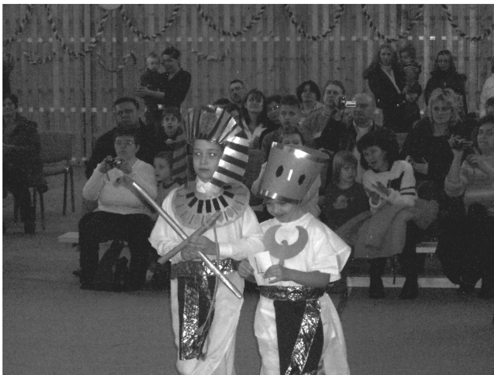
Farsang: fáraó és felesége