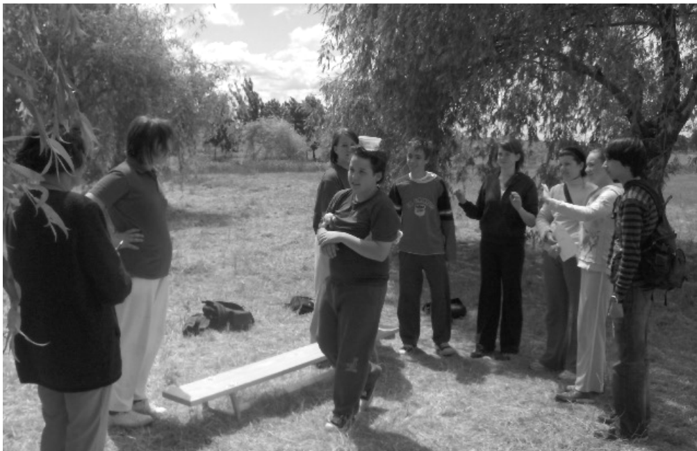
Gyermeknap: Vigyázz a tojásra!