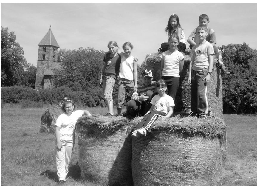
Elfoglaltuk a „várat”!