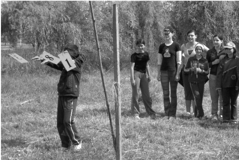
Gyermeknap: Hol vagytok?