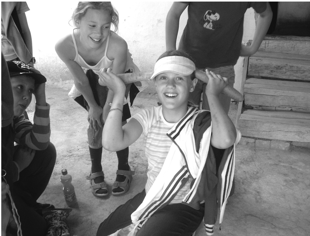
Vidám percek az erdei iskolában