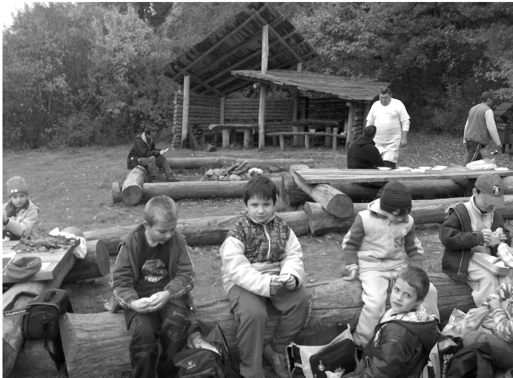
1. és 2. osztályosok a Gyadai réten