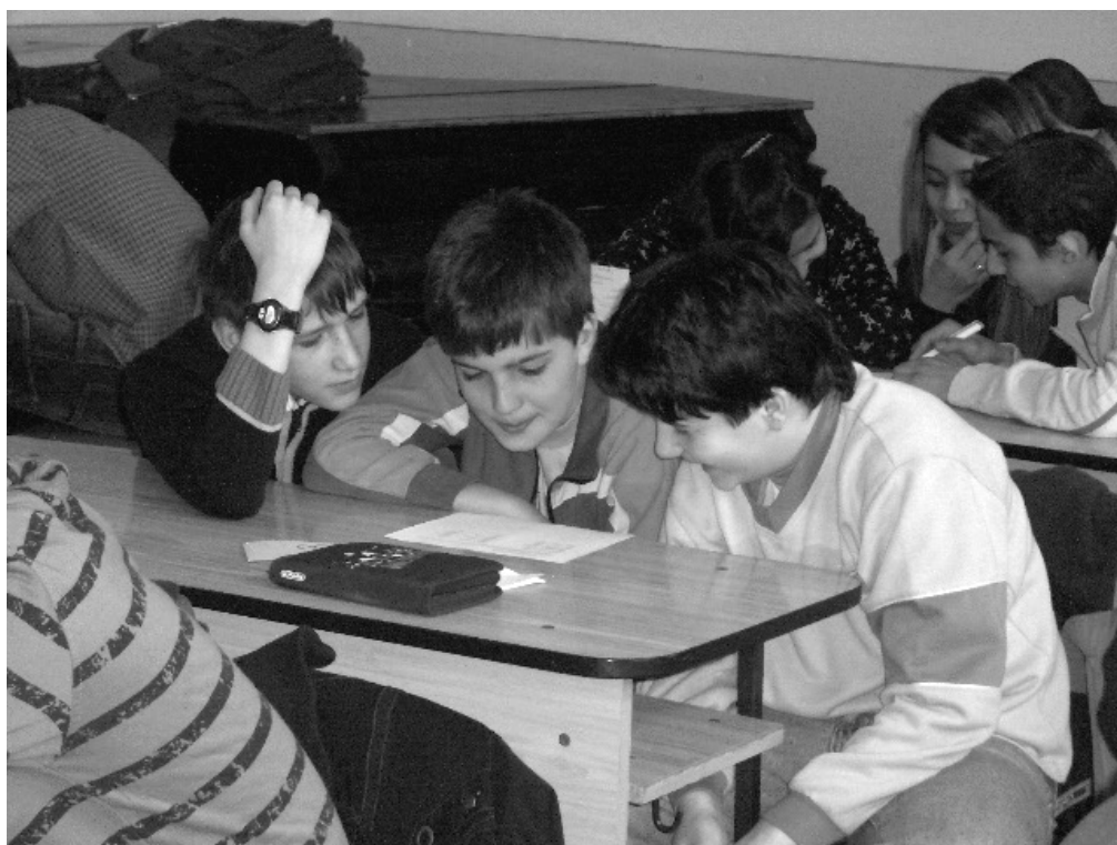
Nyelvi játékok a Rákóczi napon