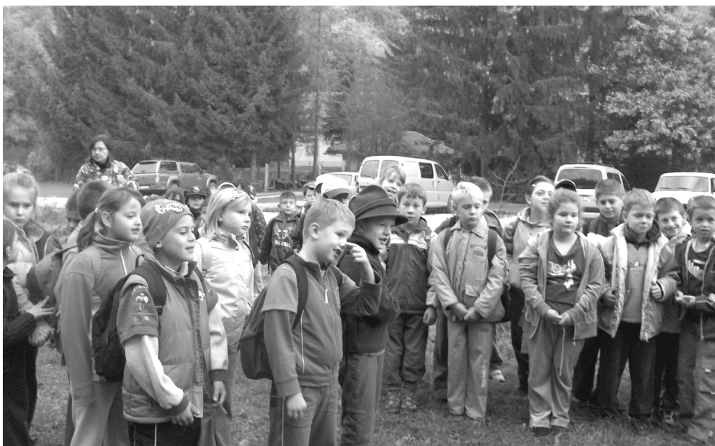
Európai Erdők Éve a Gyadai réten