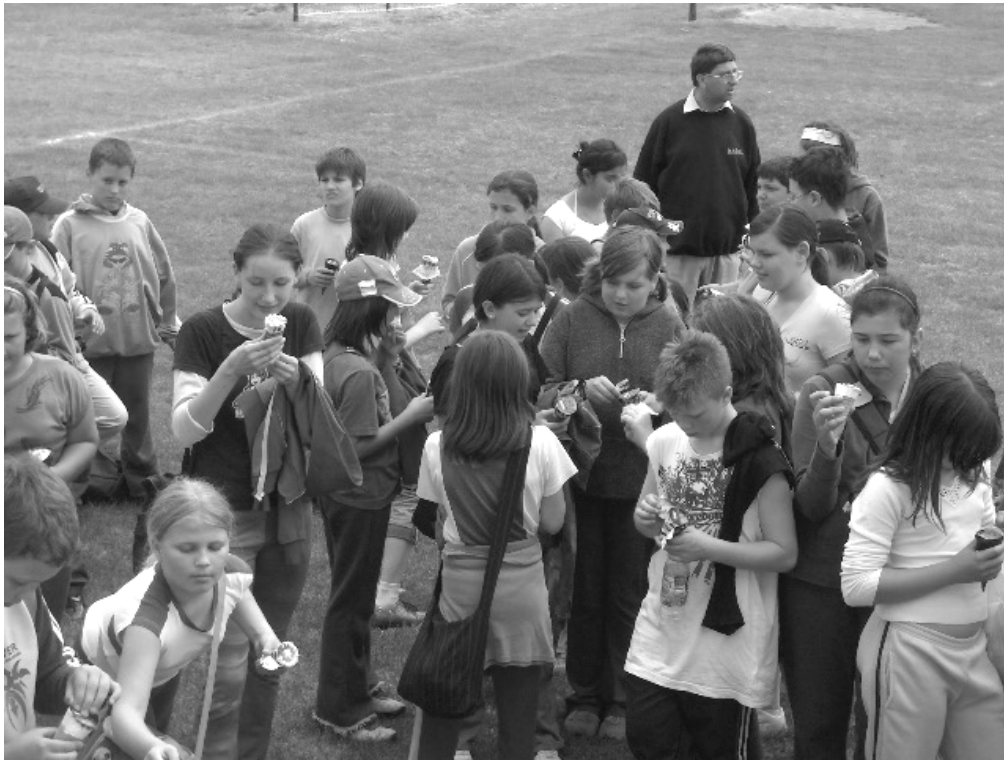
Egy fagyaltal mindig jólesik