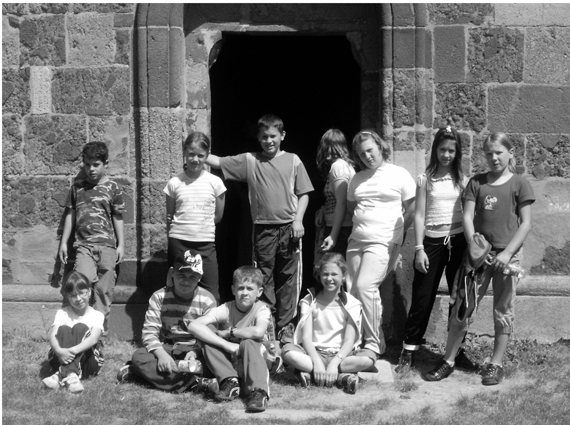
4. osztályosok a Szent István -templomnál