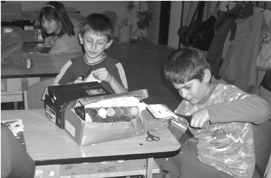
Adventi készülődés: karácsonyi ajándékot készítenek tanulóink