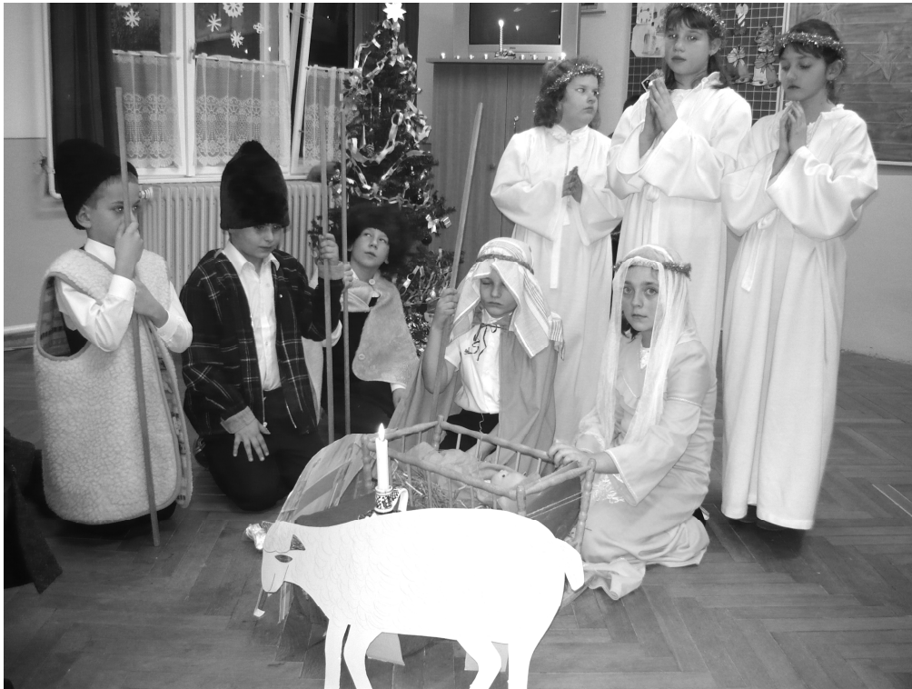
Karácsonyi ünnepség a 3. osztályban