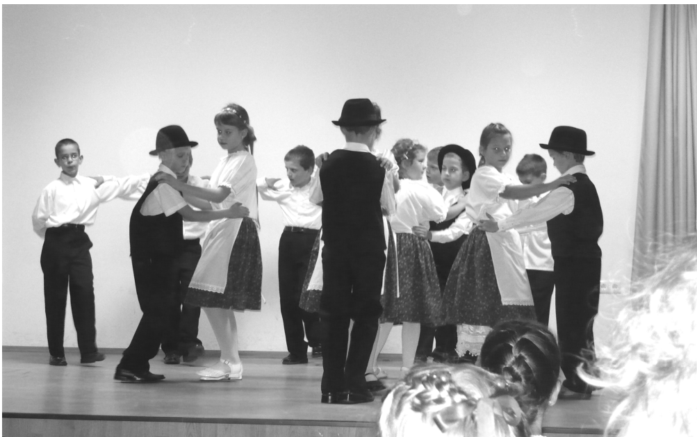
Táncosaink a deákvári lelki napon