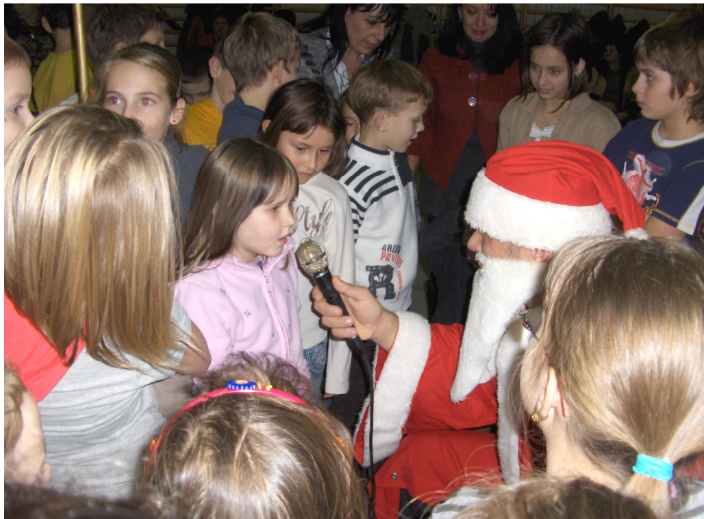
A Mikulás bácsi ebben a tanévben sem került el bennünket