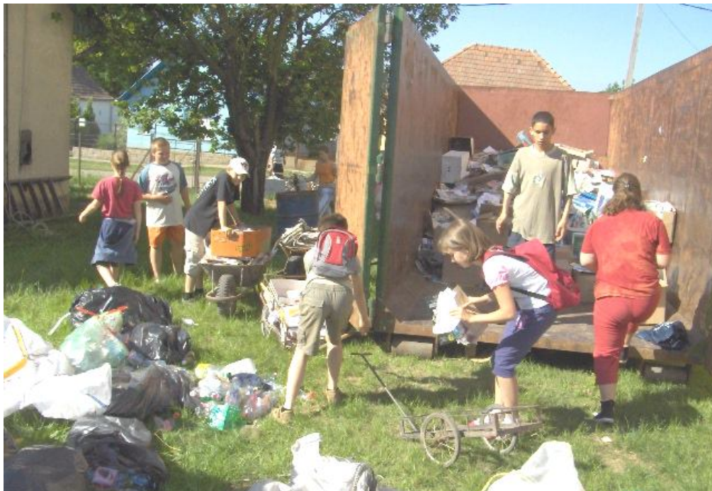
Itt a konténer még majdnem üres