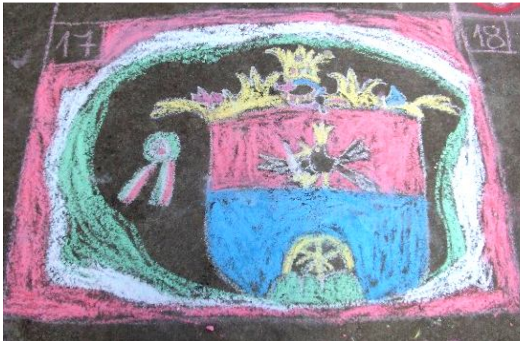
Az egyik díjazott aszfaltrajz