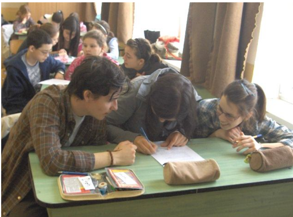
Töriseink a Rákóczi napon