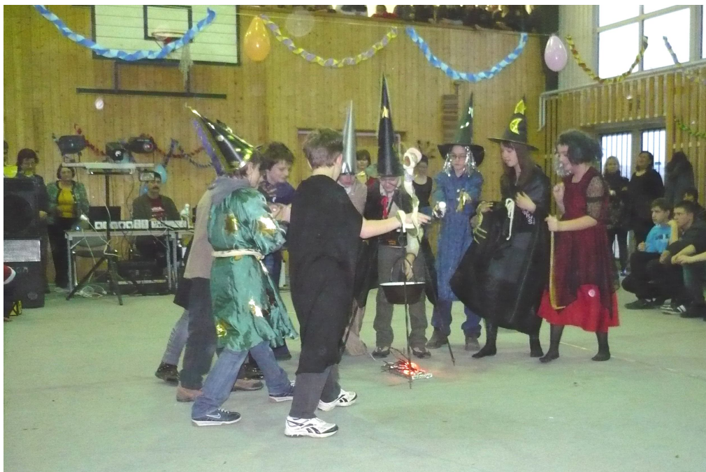
Vajon mit főznek a boszorkányok?