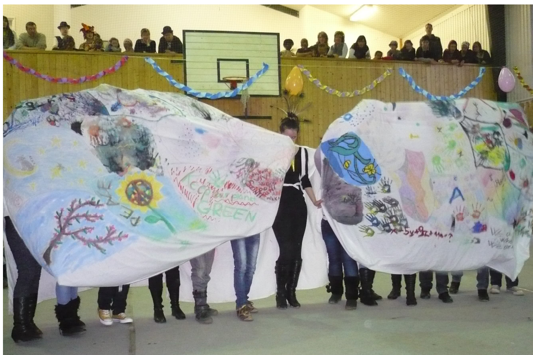
A 7. osztályosok látványos farsangi bemutatója