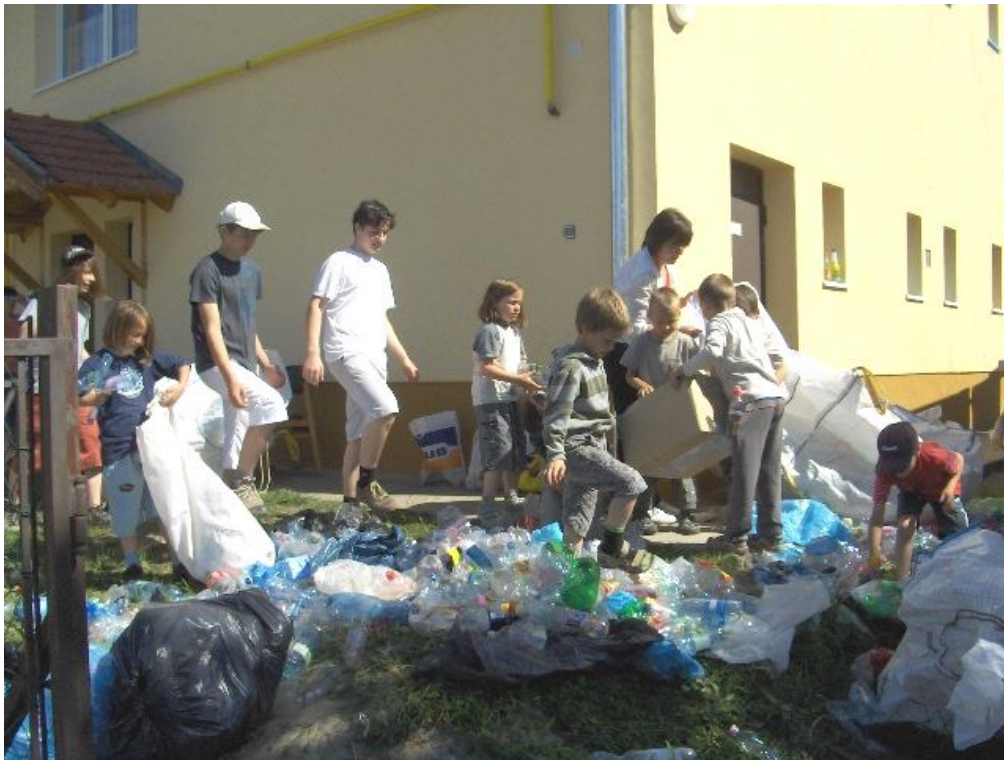
Zsákoljuk a palackokat