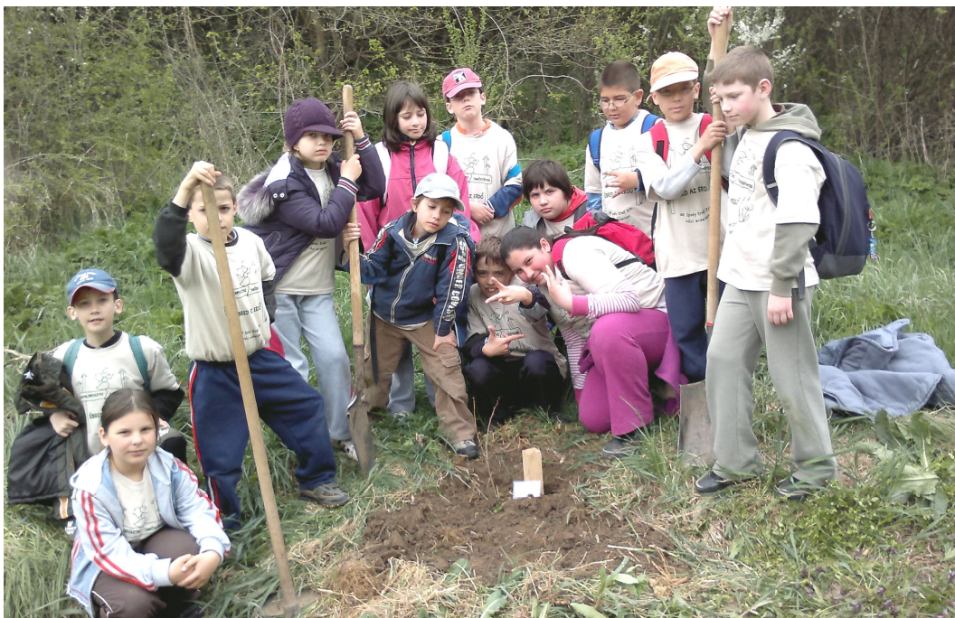
Emléket hagytunk a Gyadai-réten: faültetés