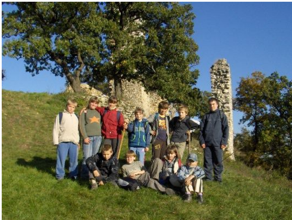
Kirándulás Csóvárra: a vár kapujában