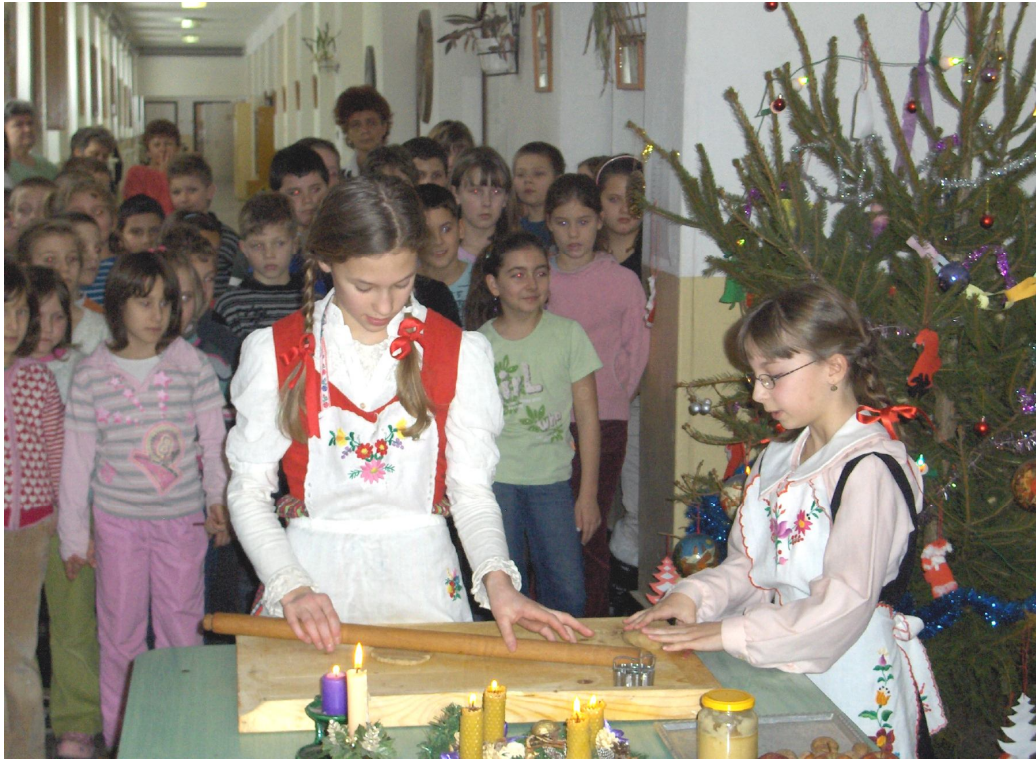
A 6. osztályosok karácsonyi mősora