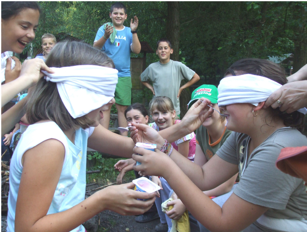
Vidám játék az erdei iskolában