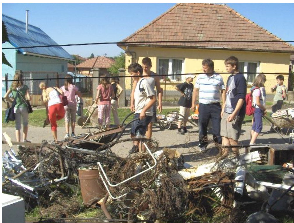
Hulladékgyűjtés: ez soha nem fog el a faluban?