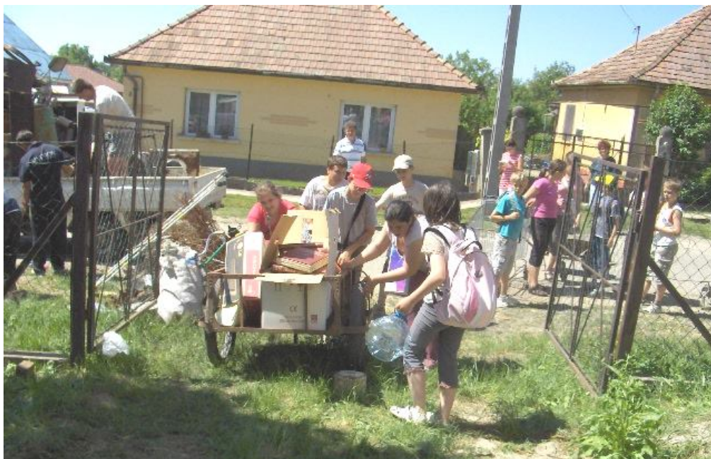
Megérkezett az újabb papírral megrakott „málnáskocsi”