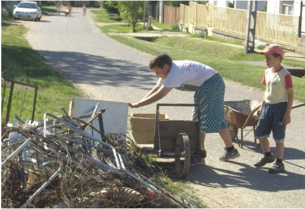
Ez a hűtőszekrény is kiszolgálta gazdáját