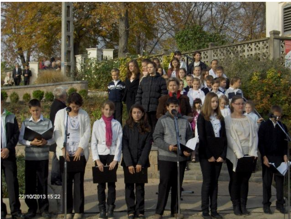
Tanulóink októberi műsora