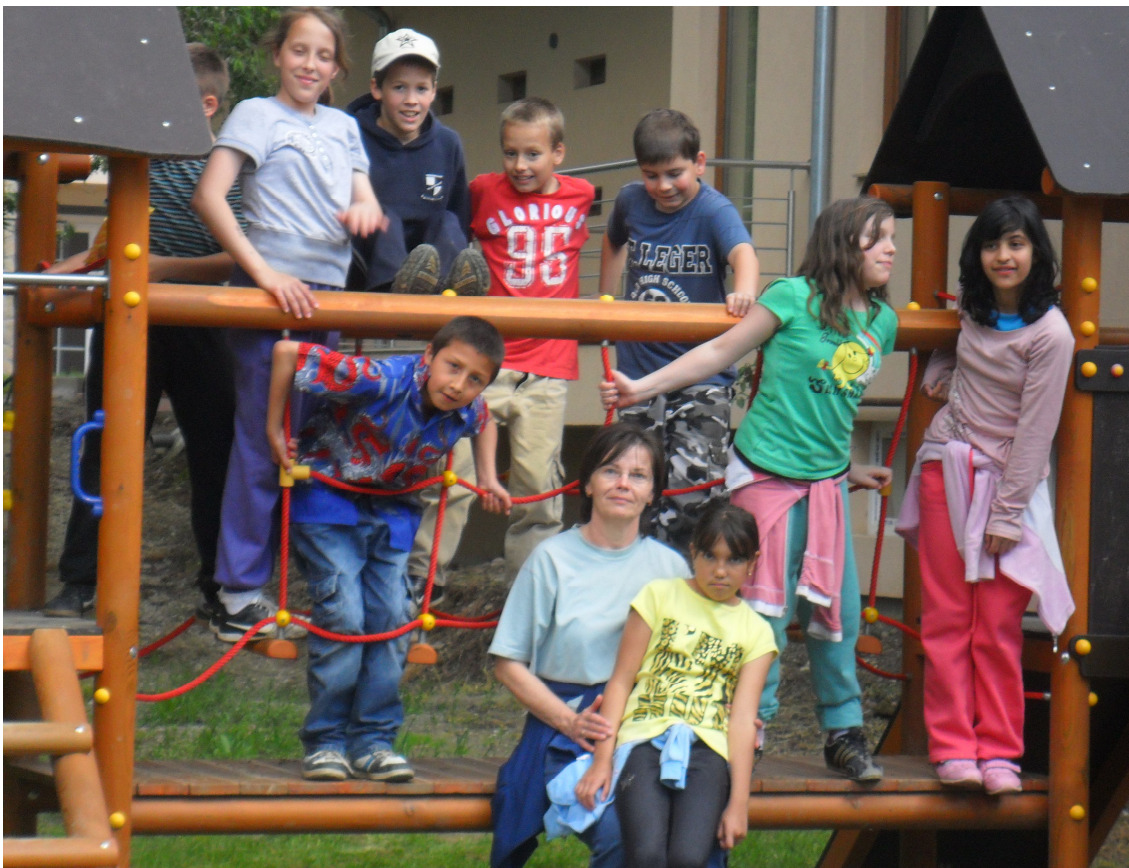
Erdei iskola vidám napjai