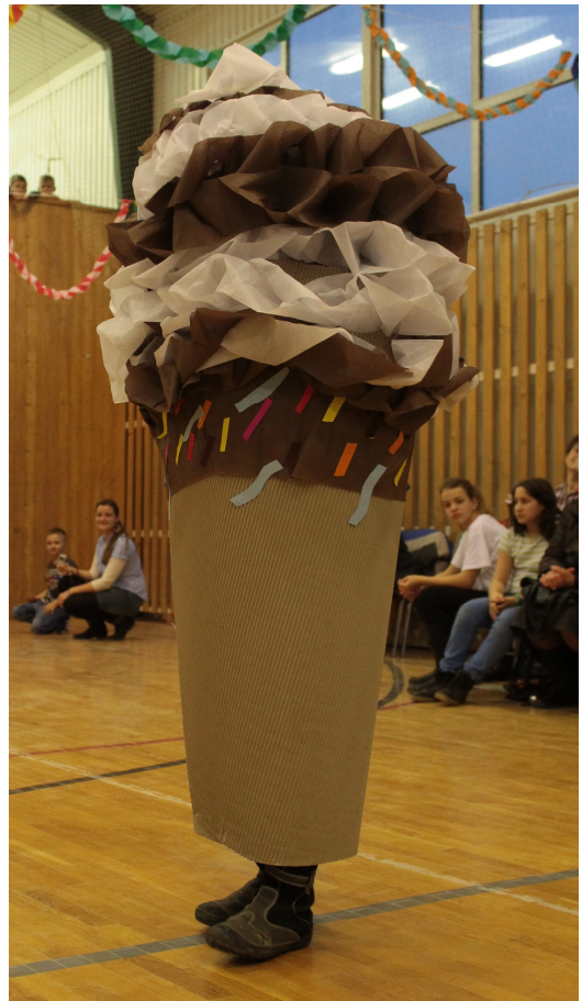
Két jelmezes a farsangról