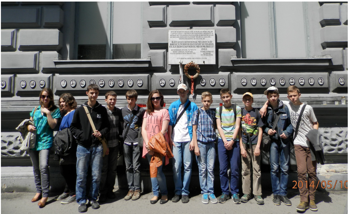
Falhoz állítva, nyolcadikosok a Terror Háza előtt