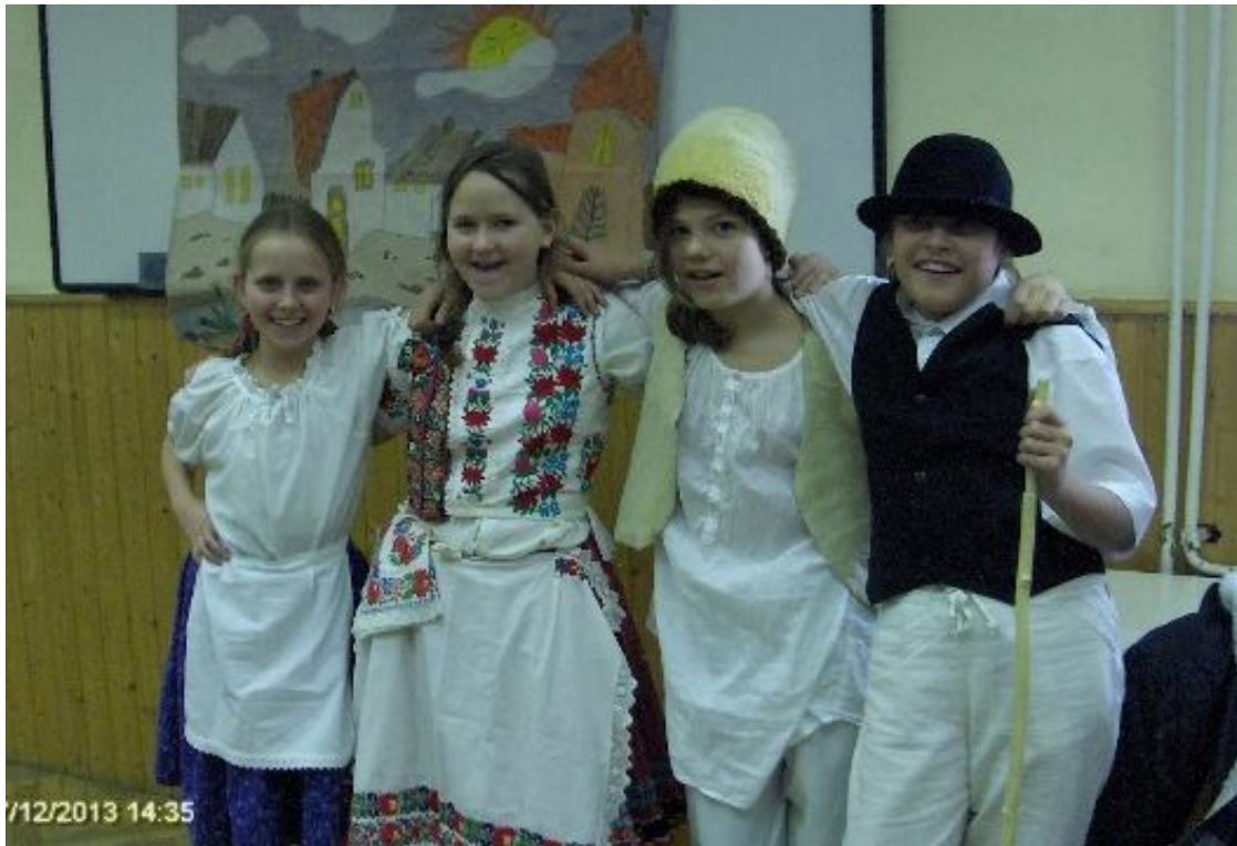
Ötödikesünk az országos versenyen