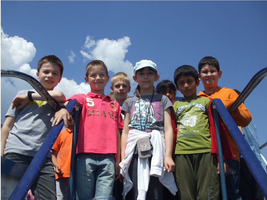
3. osztályosok Visegrádon