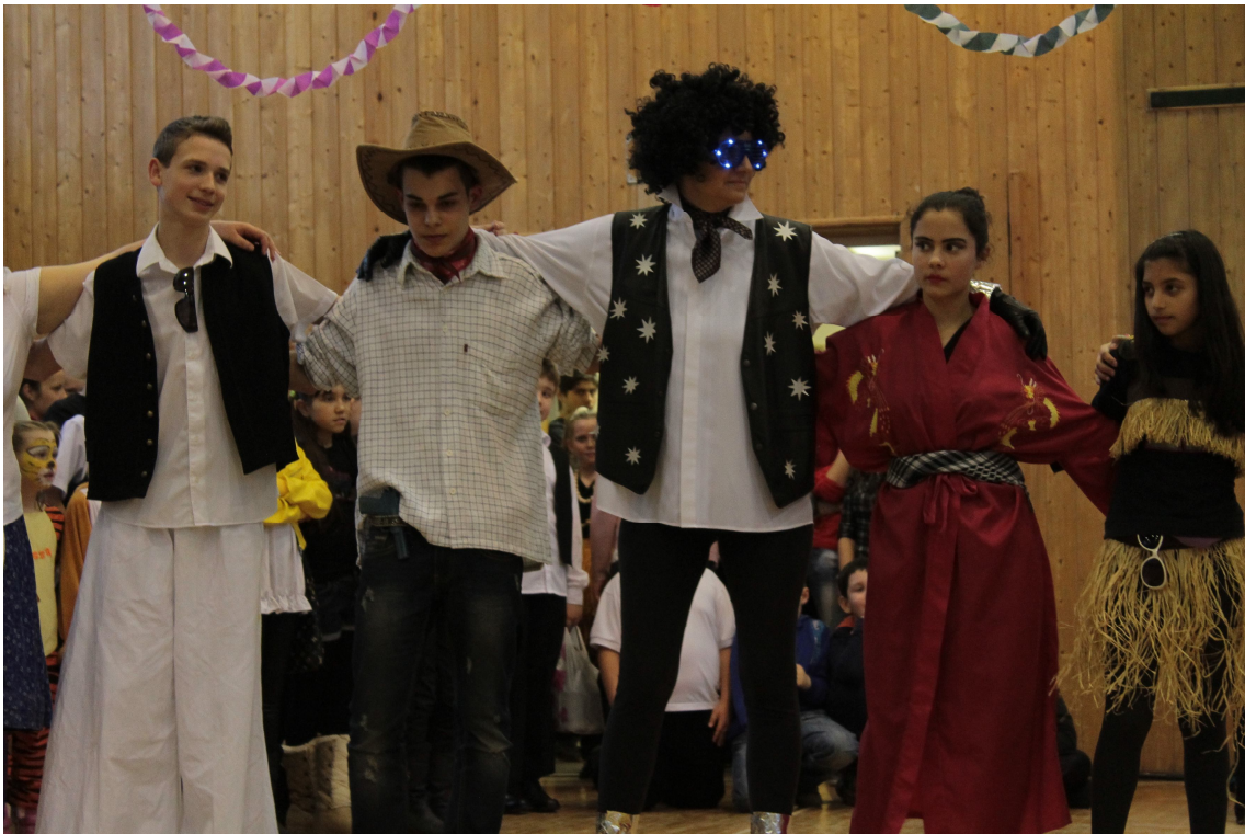
Énekesek a Föld minden részéről