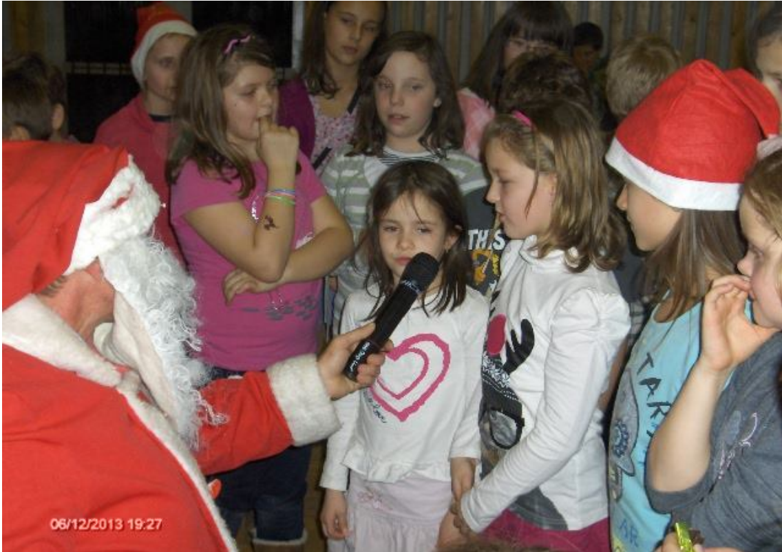
A Mikulásnak örömmel énekeltek