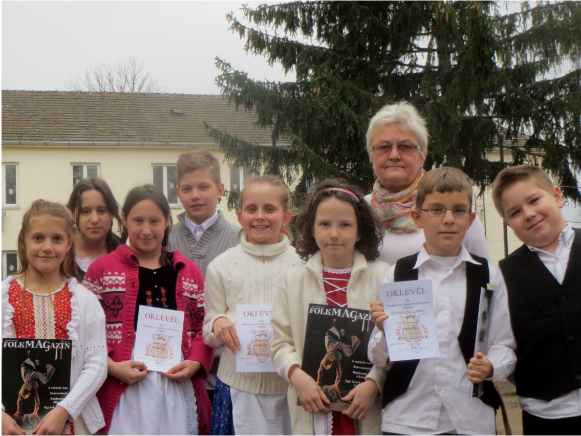
Énekeseink a szőlőligeti versenyen