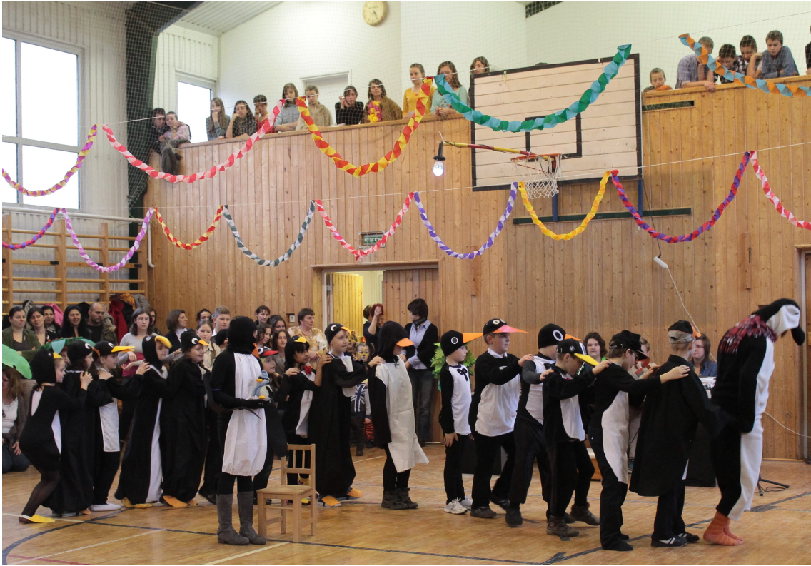
Farsangi vidámságok: pingvinek a sportsarnokban