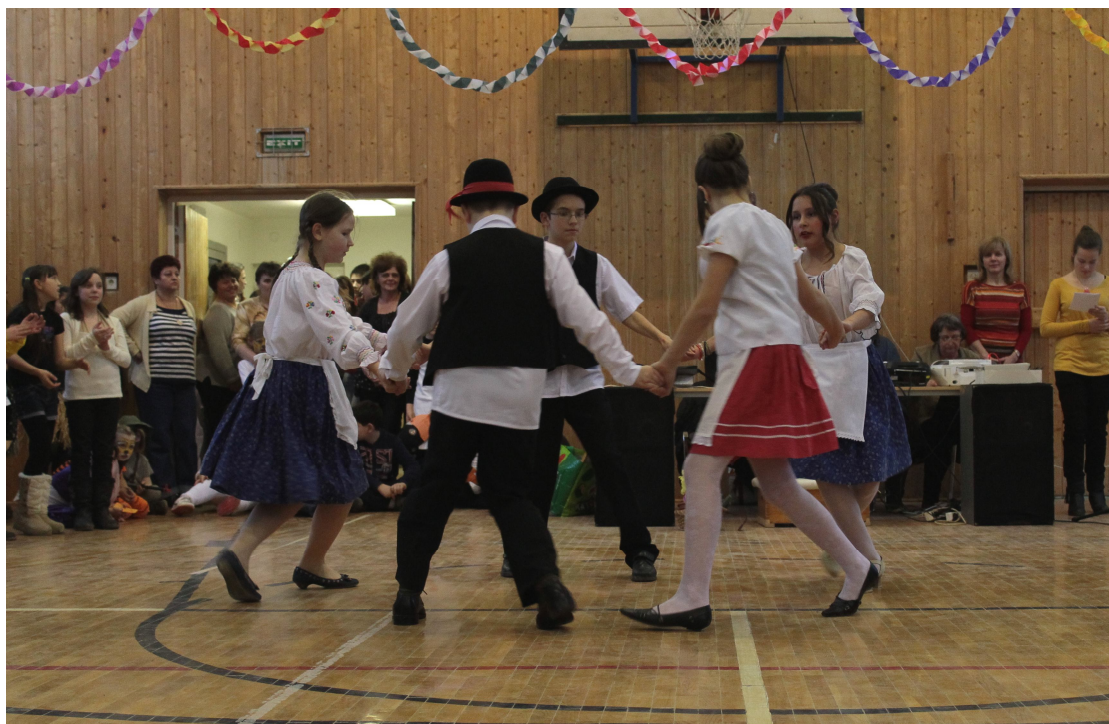
Farsangi mulatozás, néptáncosok