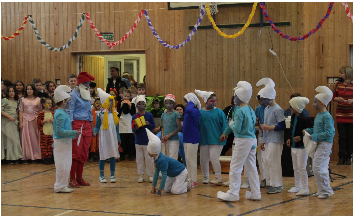
A törpök is vendégeink voltak