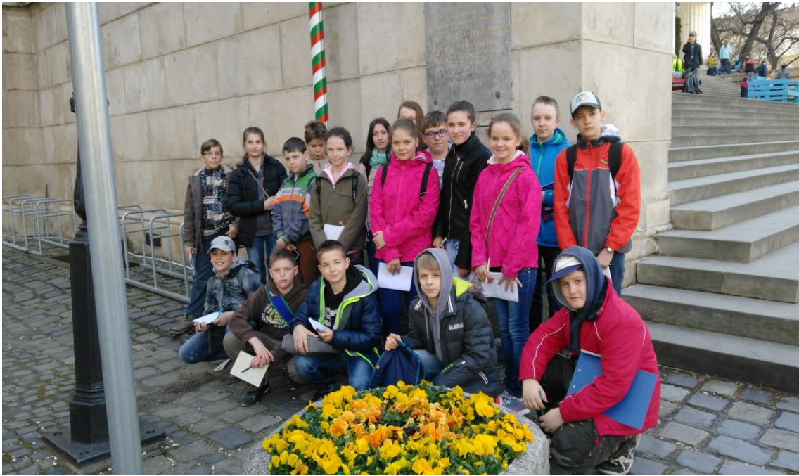
Ötödikesek budapesti kirándulása