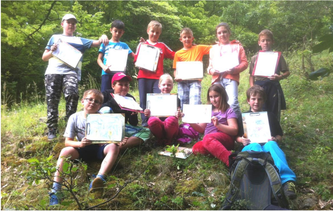
Negyedikesek az erdei iskolában