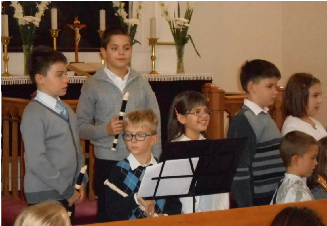
Hangverseny az evangélikus templomban