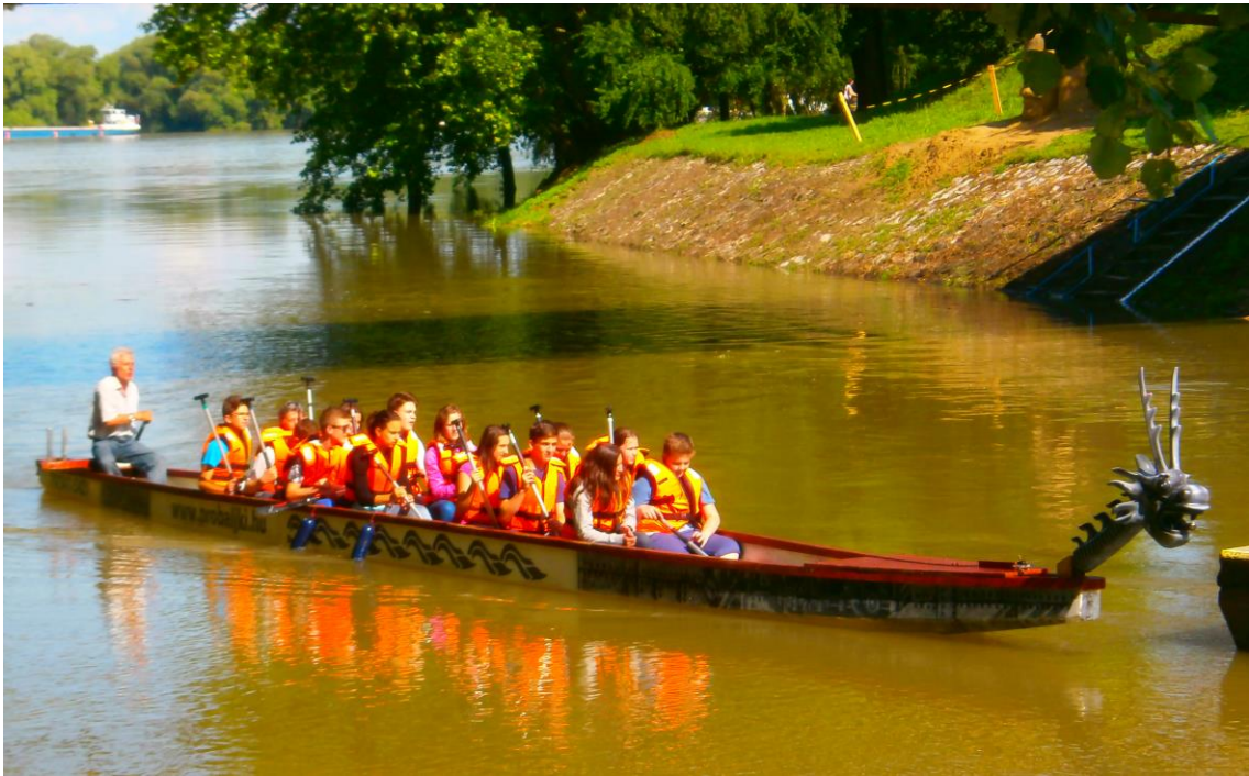
A sárkányhajózó hetedikesek