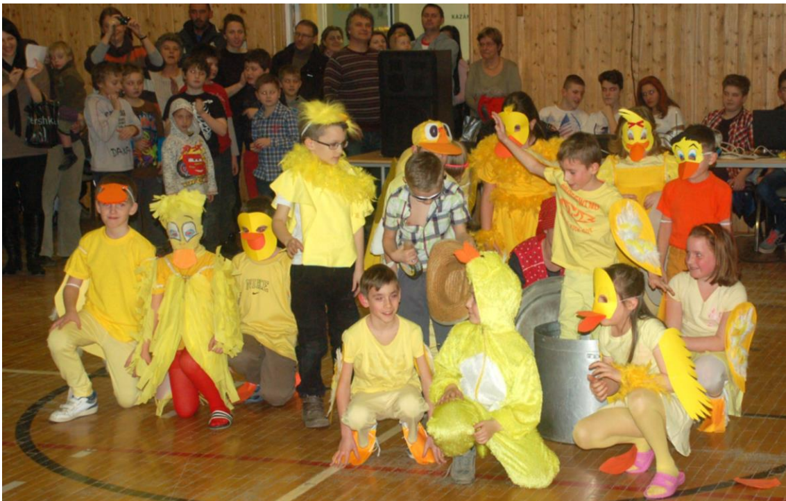
Másodikosok farsangi jelenete