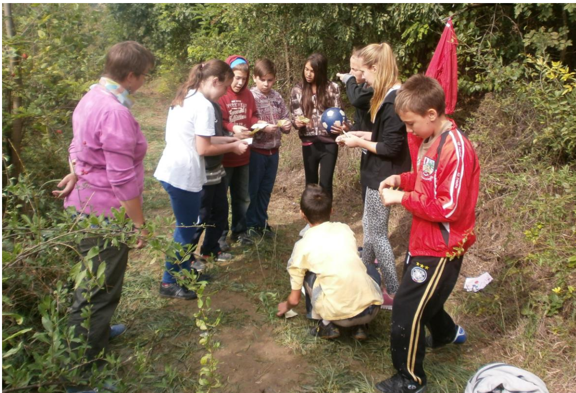
Hatodikosok az akadályversenyen