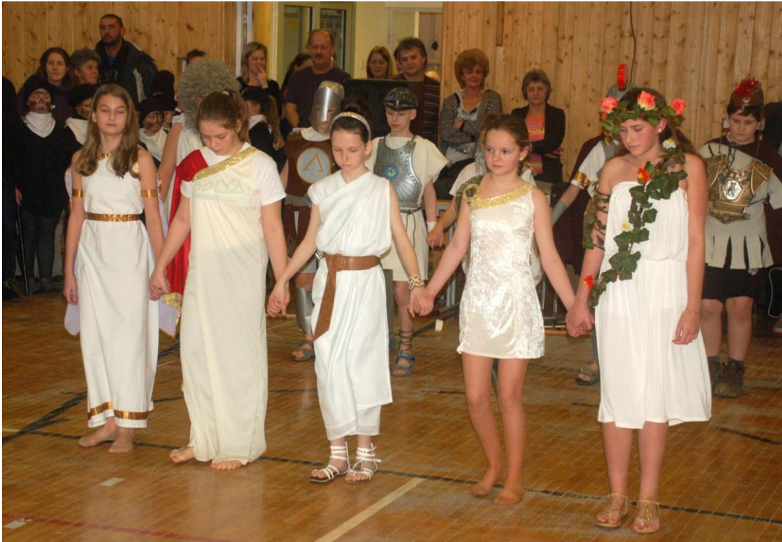
Ötödikesek farsangi jelenete