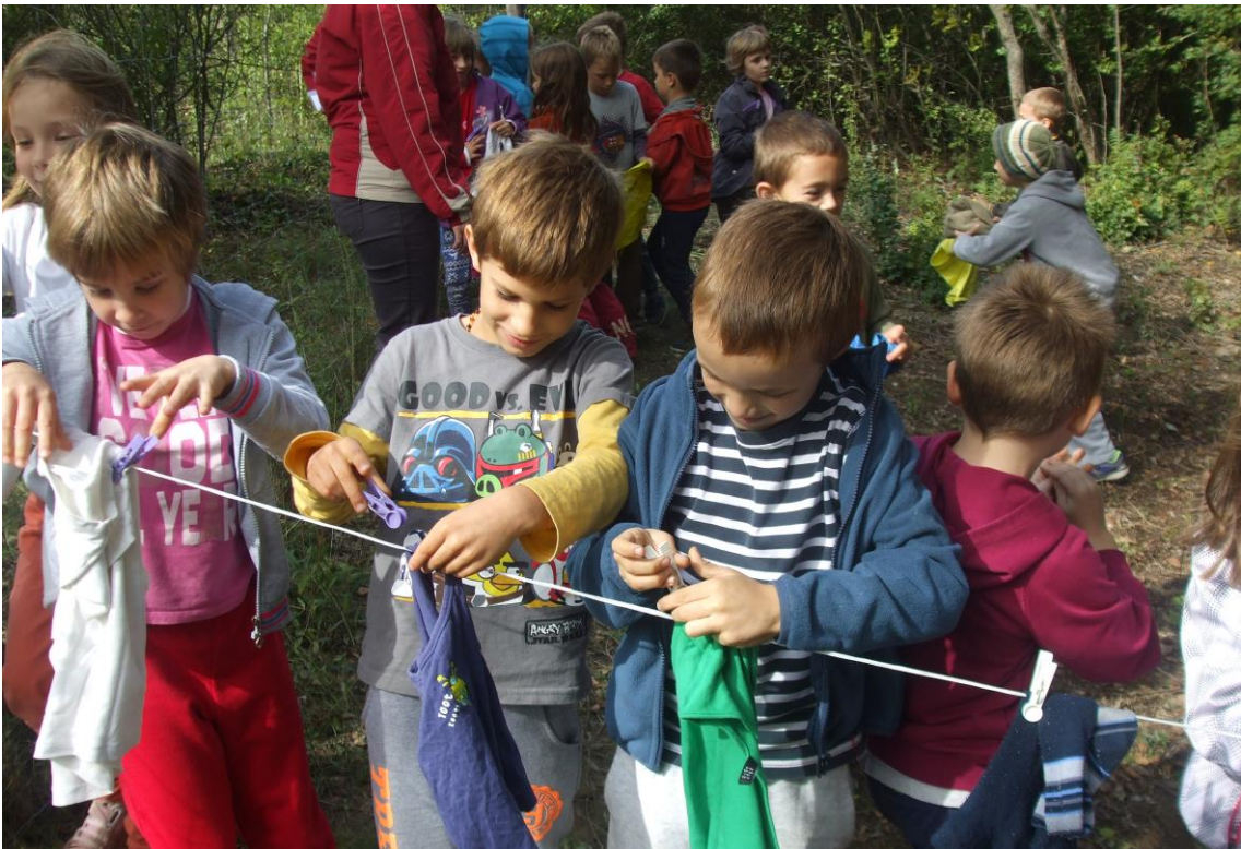
Munkában a teregetők