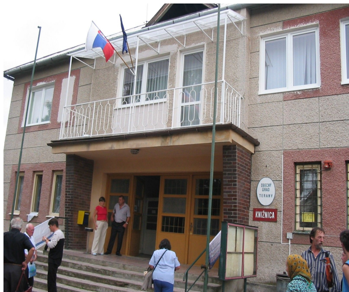
MŰVELŐDÉSI HÁZ, POLGÁRMESTERI HIVATAL