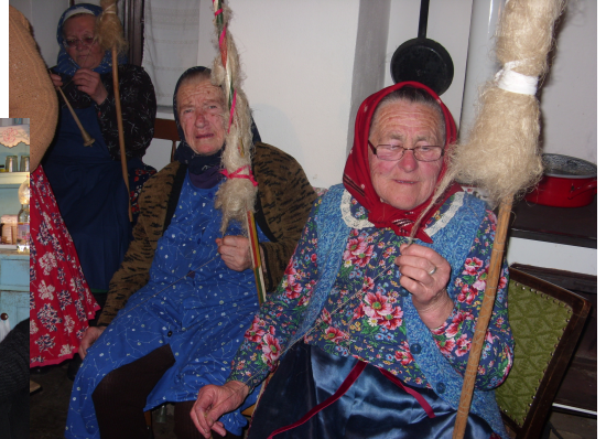
Perdül a rokka, Röppen az szoknya. Asszony s lánya, szövi és fonja...