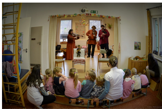
Zeneórák az Igriczekkel