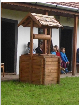
Az új kút