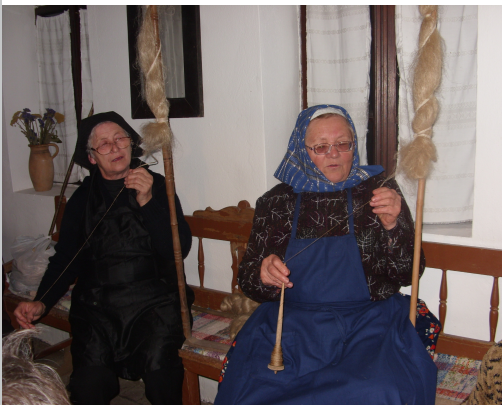
Sző, fon nem takács...