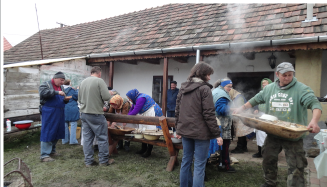
Bár az időjárás nem volt felhőtlen, de a hangulat (a disznót leszámítva) az volt...