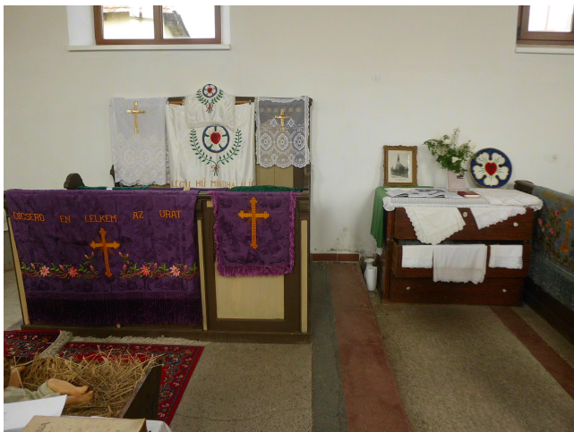
Evangélikus szakrális emlékek