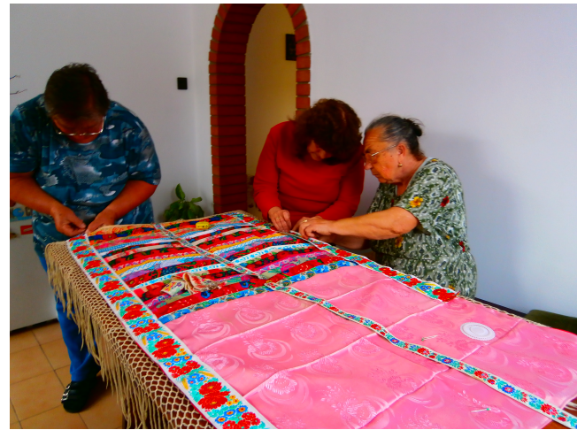
Sok szorgos kéz ha összefog! S máris kész a keresztelési terítő.