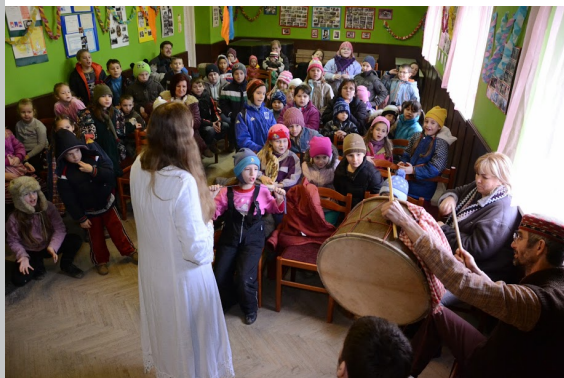
Évkerék Társulat: Világszárnya, az égitestszabadító

2014 szeptembere óta havonta két-három alkalommal mese, muzsika, tánc, játék és ének ragyogja be Terény iskoláját és óvodáját. A tanévben ugyanis mindkét intézmény helyszíne lehet a szendehelyi Galambház Egyesület „Aranyalma projektjének”. Hagyományőrző néprajzi, népművészeti foglalkozások ezek, melyek valóban aranyalmák mindenkinek: óvodásoknak, iskolásoknak, és a Terénybe érkező művészeknek is.