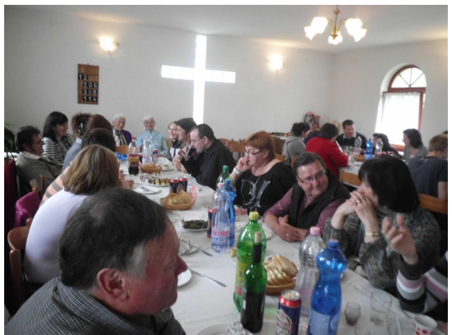
Szlovák Teranyból érkezett vendégek fogadása