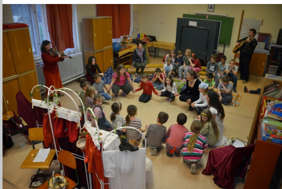
Zeneóra, Angyaltánc iskolásoknak