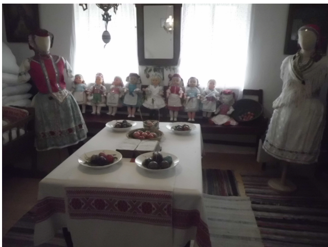
Népviseletes babák és írott tojások