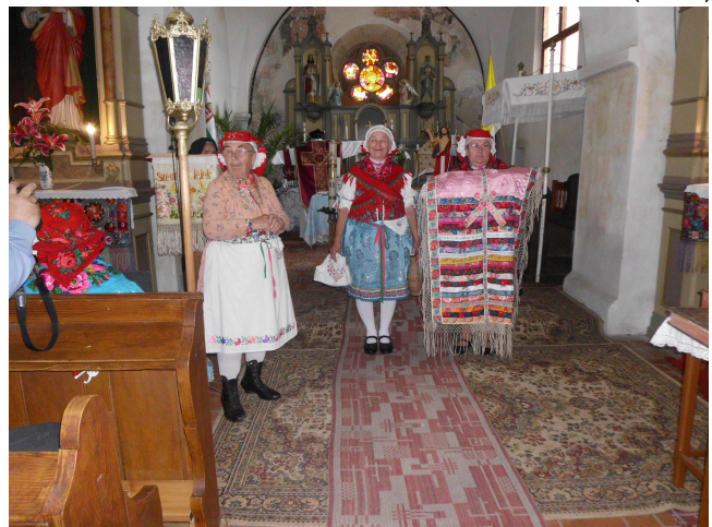
Az elkészült keresztelési kendő