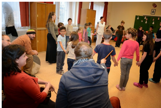
Moldvai táncház a Tázló együttesel