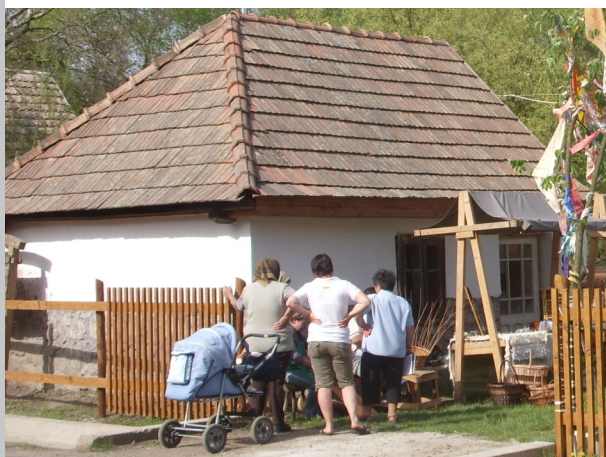
A felújított kovácsműhely