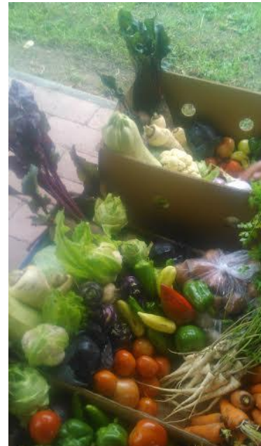
Molnárné Széles Ágota