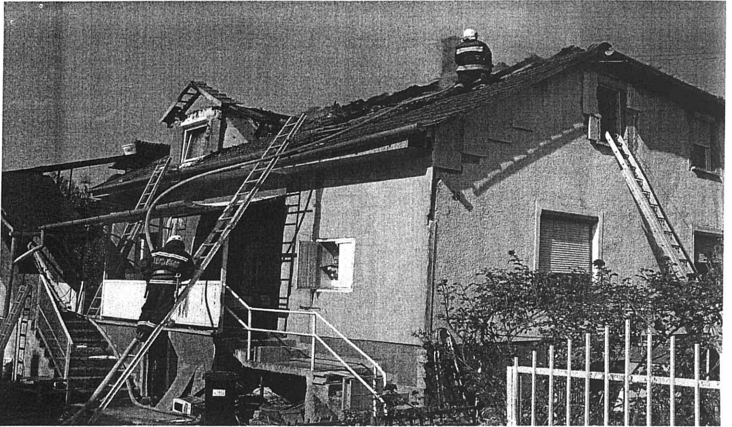
Fent: Lakóház tűz