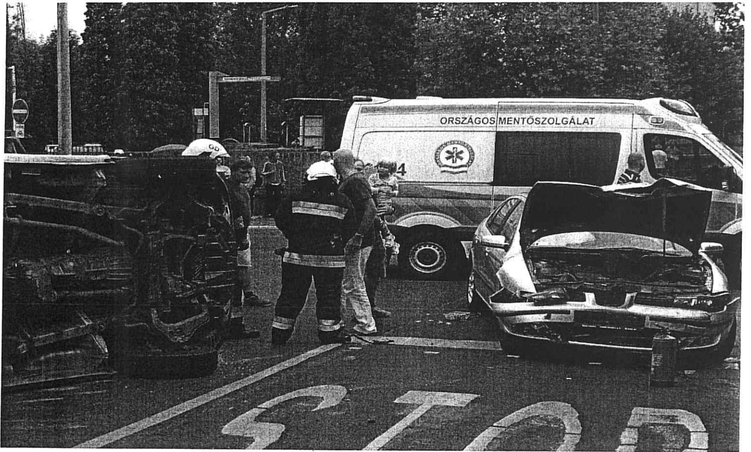
Lent: Műszaki mentés