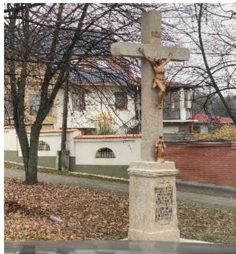
A KERESZT FELÚJÍTÁSÁT MAGYARORSZÁG KORMÁNYA TÁMOGATTA. A NEMZETKÖZI EUCHARISZTIKUS KONGRESSZUS ÉVÉBEN 2021.