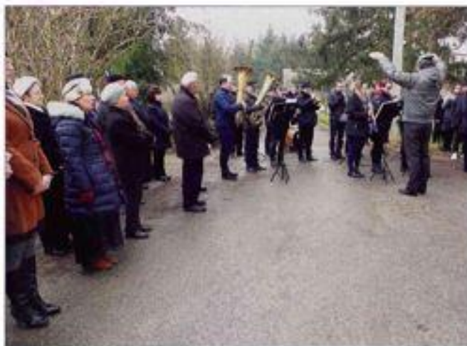
Die Blaskapelle aus Bogdan wirkte bei der Gedenkfeier mit