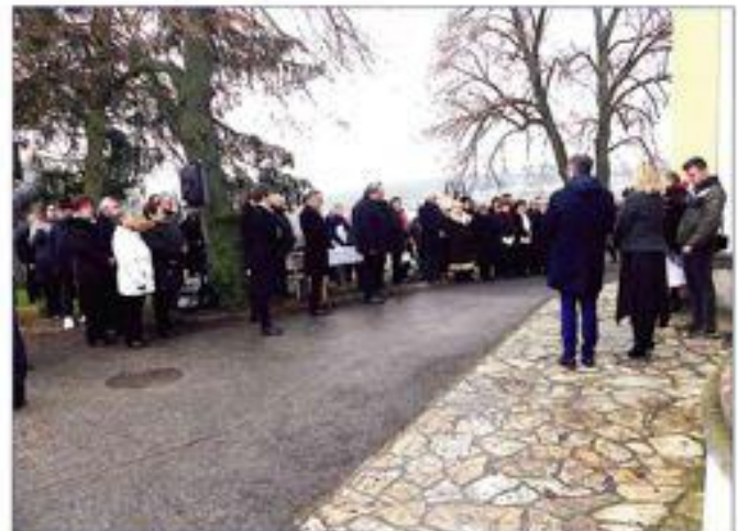
Teilnehmer der Gedenkstunde

Beim Gedenktag des Verbandes der Region Nord am 8. Jänner kamen Ehrengäste und die Familienmitglieder der Hinterbliebenen aus Berkina und der Region zusammen. Mit beim Transport 1945 waren auch Ungarndeutsche u. a. aus Sebegin, Großmarosch, Kleinmarosch, Sende und Kerecsend. Die traurige Geschichte der Verschleppten war lange ein Tabuthema, Anfang der 90er fingen die Menschen auch in Berkina an, ihre Geschichte zu erzählen. Daraus entstand